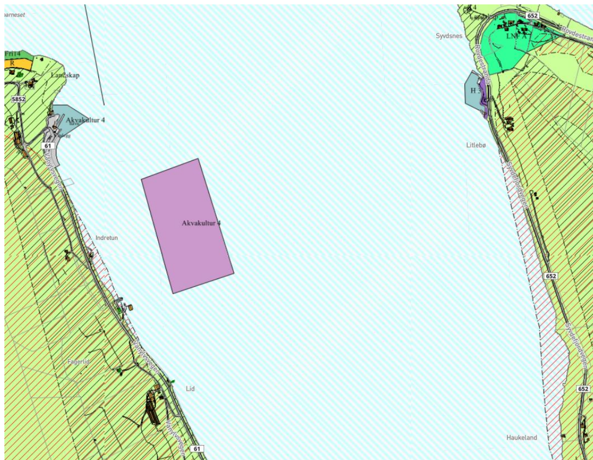
Figur 1: Utsnitt fra gjeldende kommuneplan som viser areal avsatt til Akvakultur (lilla areal) ved Indretun.

I kommuneplanen er det ved Indretun avsatt areal til Akvakultur på ca. 106 000 m 2 . Vi ønsker at dette flyttes mot øst til Litlebø og størrelsen økes til ca. 285 000 m 2 , dette for å få et område som har tilstrekkelig areal for et akvakulturanlegg som ønsket med tilhørende fôrflåte.