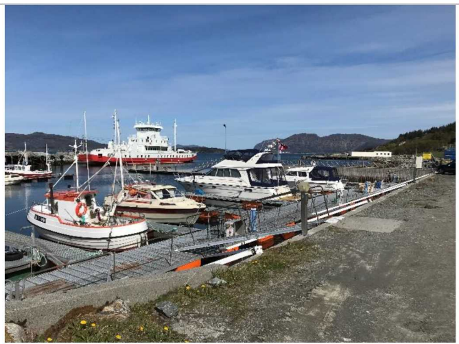
Figur 1-2: Bilde fra eksisterende Klovningen havn. Til høyre i bildet ses næringsbygget på næringsområdet nord i havnen.