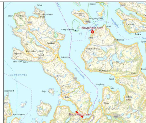
Figur 1-1: Oversiktskart som viser plassering av Klovningen havn og kommende Stad skipstunnel.

I Figur 1-1 ser man plassering av Klovningen havn og i Error! Reference source not found. er det et bilde av eksisterende havn.